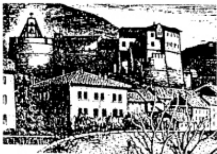
MOSTRA NUMISMATICA-FILATELICA-CARTOFILA 70° anniversario CAMPANA dei CADUTI di ROVERETO