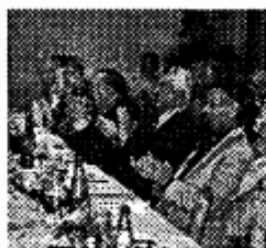
Nelle foto, alcuni momenti dell'incontro tra i Circoli filatelici trentini e il "Merkur" di Innsbruck, svoltosi domenica 29 settembre a Mori.

Domenica 29 settembre si è svolto l'annuale incontro tra gli amici del «Merkur» di Innsbruck e gli iscritti alla Società filatelica Trentina con le relative associazioni periferiche. L'organizzazione della giornata era stata affidata al nostro Circolo, che ha risposto in modo efficiente e positivo alle aspettative. Alla manifestazione hanno dato la loro adesione circa 90 partecipanti, quasi equamente divisi tra gli ospiti tirolesi e gli iscritti trentini.